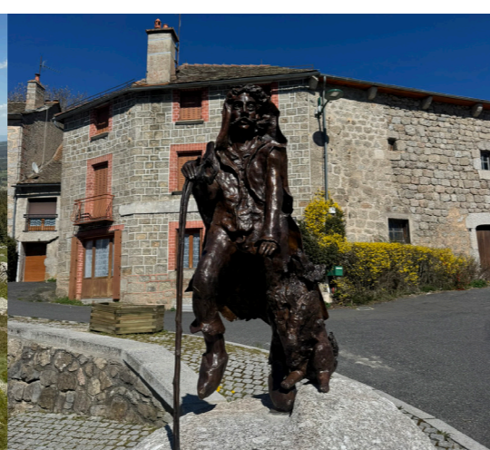
Statue de berger en bronze - rappel de la transhumance - Rieutort-de-Randon