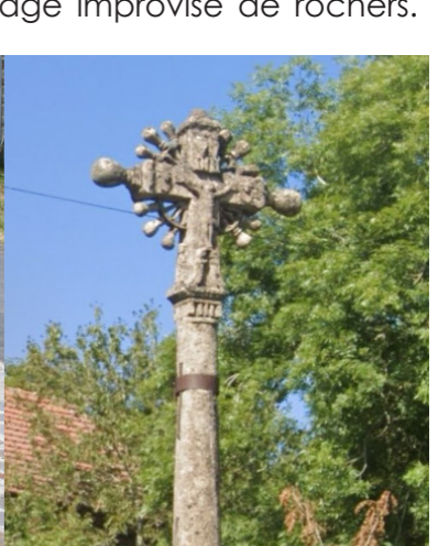
Croix de Chauvets