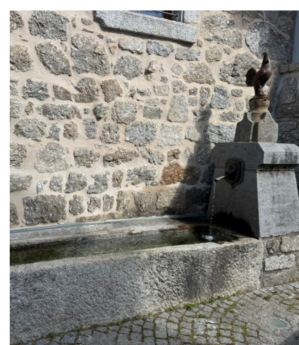
Fontaine du Theron à Rieutort-de-Randon - ancien abreuvoir