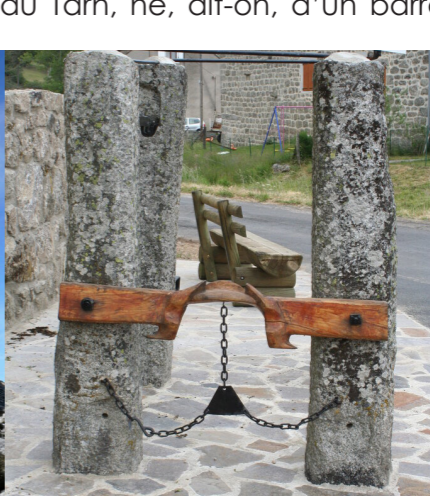
Ferradou du Bouchet - métier à ferrer les bêtes