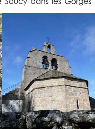
Clochers en peigne - église de Saint-Amans