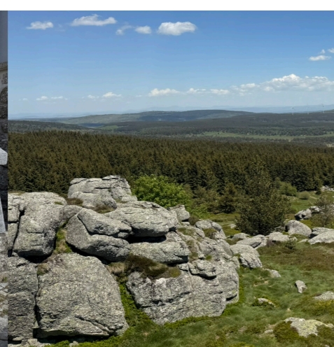
Chaos granitiques - Truc de Fortunio