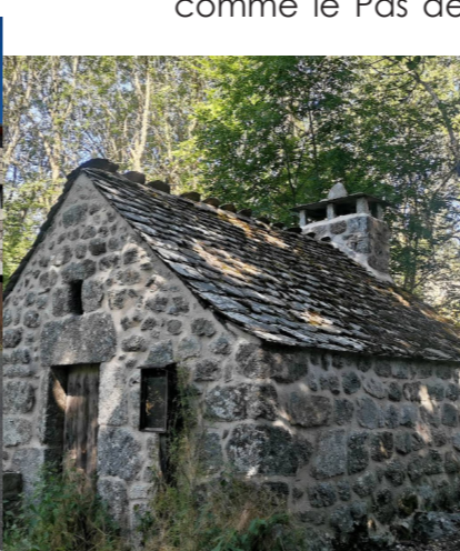
Ancien four à pain de Boussefol